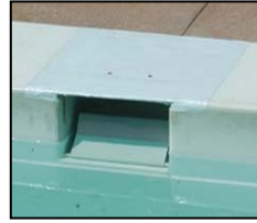
பாதுகாப்பான திருத்தி அமைக்கப்பட்ட சுத்திகரிப்புப் பெட்டி (skimmer box)