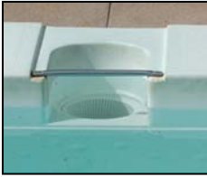
ஆபத்தான சுத்திகரிப்புப் பெட்டி (skimmer box)

இல்லை - 'உள்வாங்குப் பகுதி வடிக்கடி' (incoming filter) யைப் பாதுகாப்பாக வைத்திருப்பதற்காக நிரந்தரமான பாதுகாப்பு முடி ஒன்றைப் பொருத்துங்கள். இப்படிப்பட்ட சரிபார்ப்பு வேலைகளை 'நார்க்கண்ணாடிப் (fibreglass) பொருட்களை உற்பத்தி செய்பவர்கள் அல்லது சரிபார்ப்பவர்களால் இந்த வேலைகளைச் செய்ய இயலும் (இவர்களைப் பற்றிய விபரங்களை மஞ்சள் பக்கத் தொலைபேசிப் புத்தகங்களில் காணலாம்). உங்களது உள்ளூர் நீச்சல்குள சரிபார்ப்பாளரால் பழைய சுத்திகரிப்புப் பெட்டிகளை மாற்றி புதிய சுத்திகரிப்புப் பெட்டிகளை பொருத்தும் மலிவான சேவைகளை வழங்க இயலக்கூடும்.