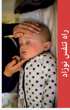
راه تنفس نوزاد

سر را به عقب خم کنید و چانه را بالا بیاورید