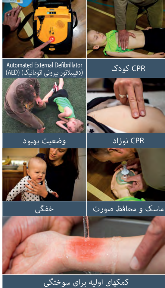
Automated External Defibrillator (AED) (دیفیلاتور بیرونی اتوماتیک)

آموزش CPR برای والدین در سایت cprtrainingforparents.org.au موجود است و نیازی به داشتن حساب کاربری ندارد. برای تکمیل تمام هفت ماژول، که می‌شود آنها را جداگانه انجام داد، تقریباً ۱,۵ ساعت زمان لازم است. ماژولهای موجود در برنامه آموزشی عبارتند از: