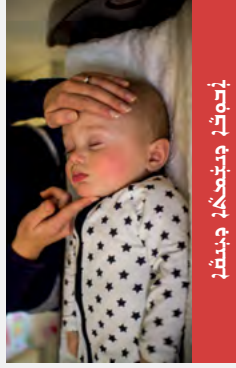
הנחיות להחייאת הילד

האם יש סיכונים מהילד? האם יש סיכונים מהילד? האם יש סיכונים מהילד? האם יש סיכונים מהילד? האם יש סיכונים מהילד?