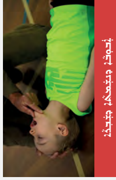
הנחיות להחייאת הילד

A האם יש סיכונים (AIRWAY) מהילד? האם יש סיכונים מהילד? האם יש סיכונים מהילד? האם יש סיכונים מהילד? האם יש סיכונים מהילד?