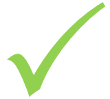
مدل امن تعدیل شده صندوق کفگیر